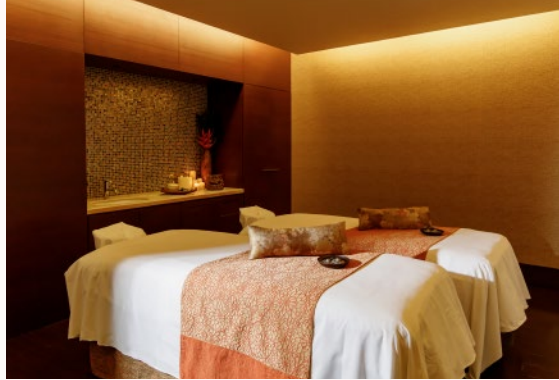
ペアルーム Couple Room