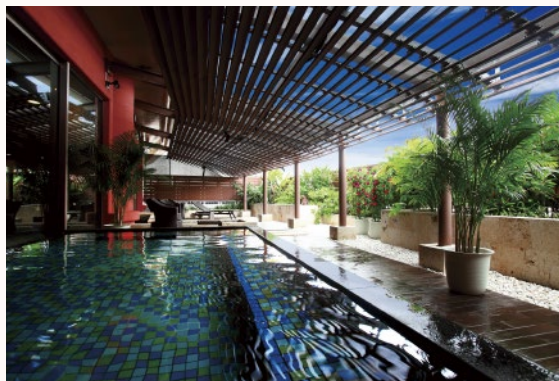
三重城温泉 海人の湯 MIEGUSUKU ONSEN "Uminchu no Yu" (Hot Spring)