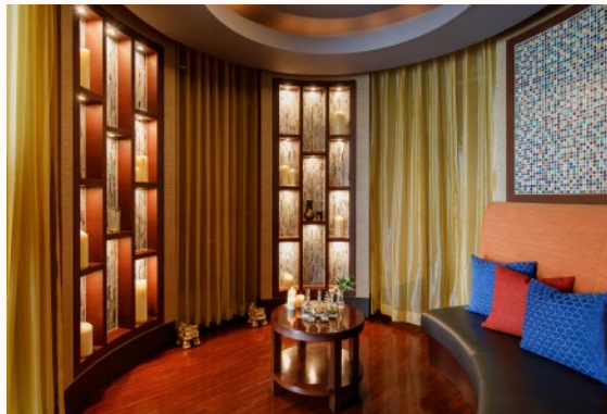
スパラウンジ Spa Lounge