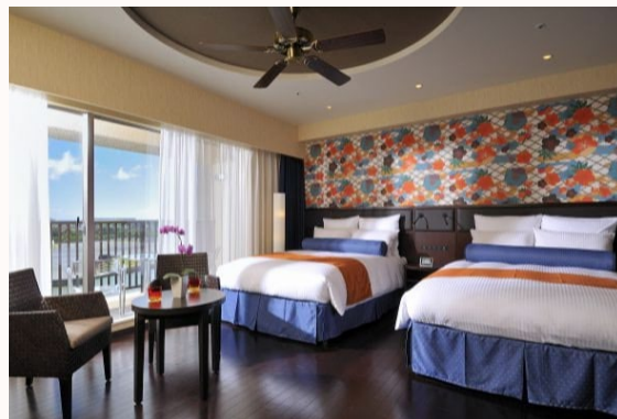
ロワジール スパタワー 那覇 ゲストルーム LOISIR HOTEL & SPA TOWER NAHA Guest Room