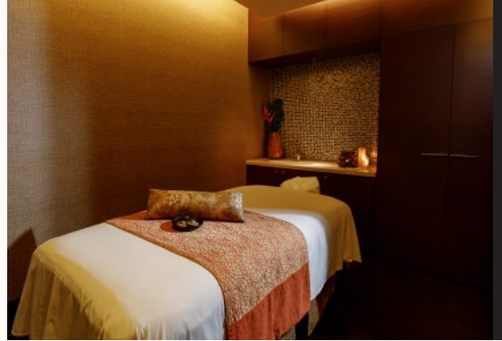
シングルルーム Single Room